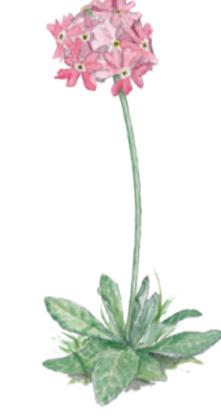
Majviva Primula farinosa Bird's eye primrose