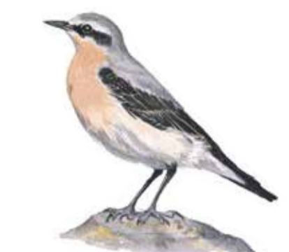
Stenskvätta Oenanthe oenanthe Wheatears