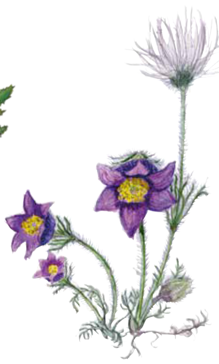
Backsippa Pulsatilla vulgaris Pasqueflower