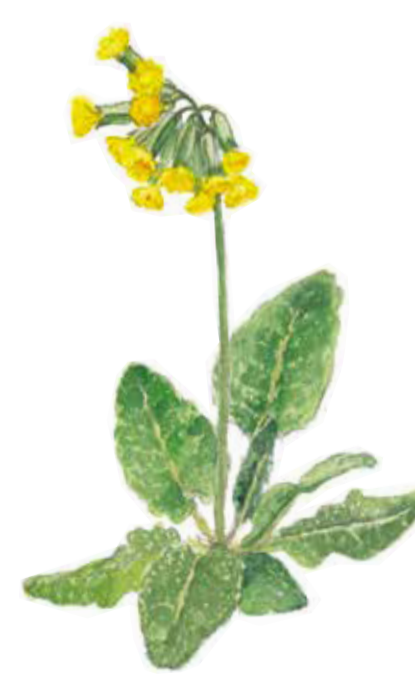
Gullviva Primula veris Cowslip