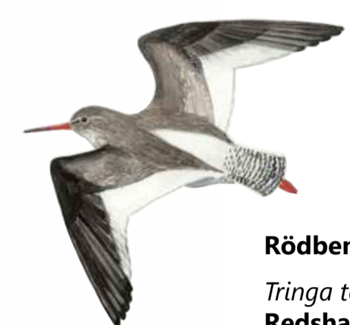
Rödbena Tringa totanus Redshank