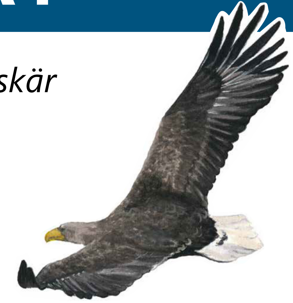
Havsörn Haliaeetus albicilla White-tailed eagle