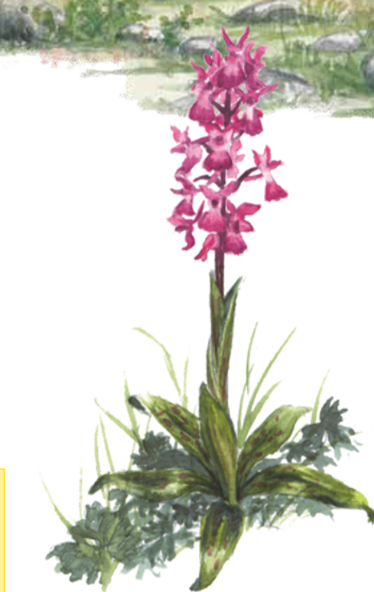
Sankte Pers nycklar Orchis mascula Early Purple Orchid