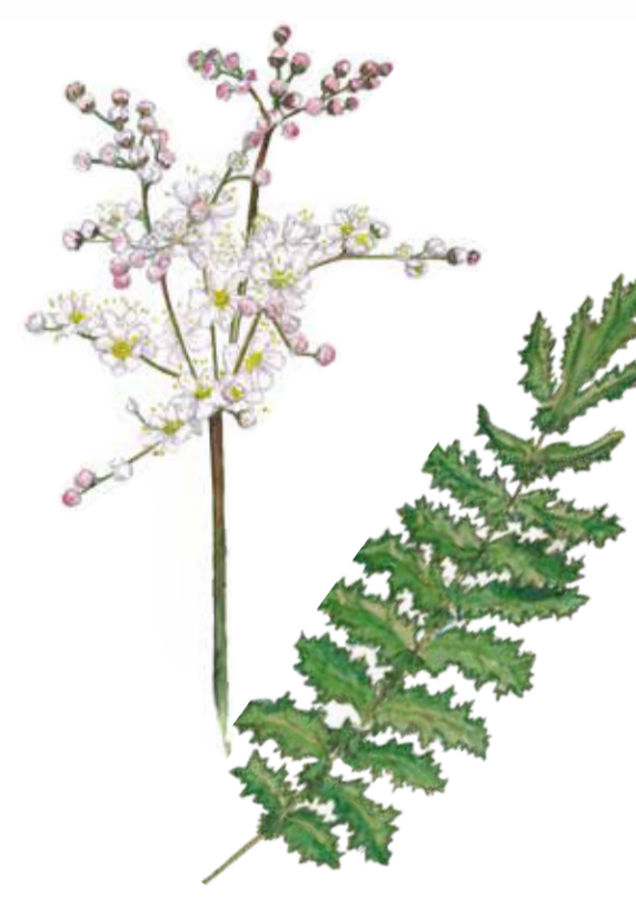
Brudbröd Filipendula vulgaris Dropwort