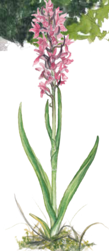
Ängsnycklar Dactylorhiza incarnata Early marsh orchid