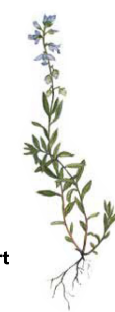
Jungfrulin Polygala vulgaris Common milkwort